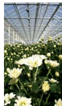
Gartnerier og landbruk