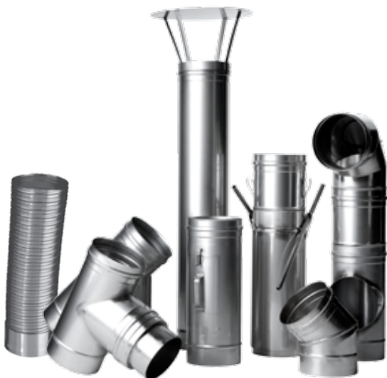
Uisolerte skorsteinslementer i syrefast stål