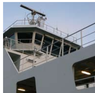
Offshore og skipsindustrien