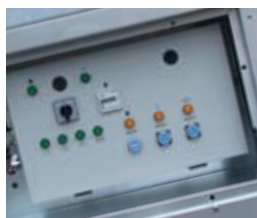
Låsbar luke for styrepanel