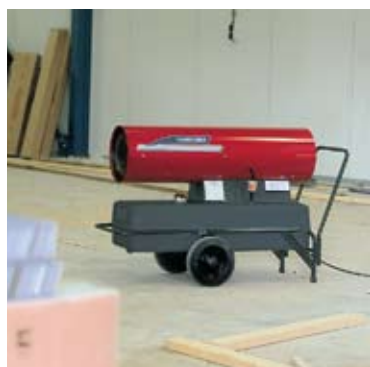
Bygg under oppføring