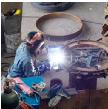
Verksteder og lagerrom